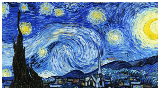
Figura 1. La Noche Estrellada. Vincent van Gogh, 1889

El pie de foto será de sentido independiente, descriptivo o referencial. El objetivo de los pies de foto es agregar información, detalles o datos no presentes en el texto principal, sin caer en redundancias u obviedades. Tampoco se utilizará como pie de foto la frase más sobresaliente del texto o la cita textual