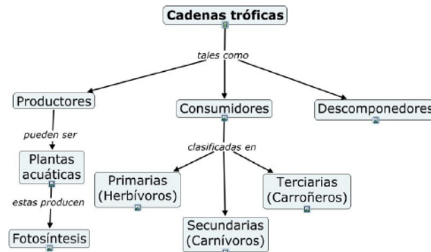
Figura 1. La figura ilustra el mapa conceptual que permite identificar los principales actores de las cadenas tróficas.